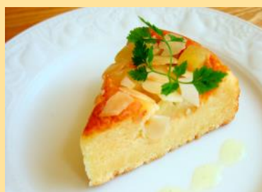
ケーキ (お選びいただけます)