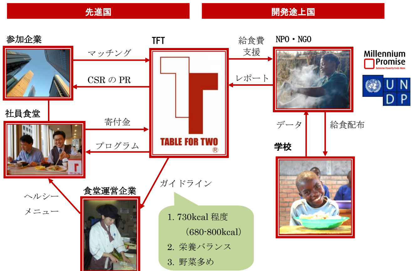
TABLE FOR TWO の仕組み

TABLE FOR TWO という名前に私たちが込めた思いは、「たとえ地球の裏側に住んでいようとも、相手を思いやる心があれば距離は縮まり、まるで一つの食卓を囲むように心を寄せあうことができる」ということです。アフリカの子どもたちと時間と空間を越えて食卓を囲み、食事をともにすることで、子どもたちの国における食料問題に思いを馳せ、彼らの国の現状を身近に感じて頂きたいと思っています。