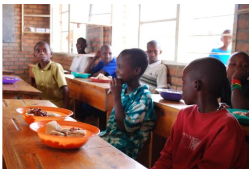
TABLE FOR TWO という名前に私たちが込めた思いは、「たとえ地球の裏側に住んでいようとも、相手を思いやる心があれば距離は縮まり、まるで一つの食卓を囲むように心を寄せあうことができる」ということです。アフリカの子どもたちと時間と空間を越えて食卓を囲み、食事をともにすることで、子どもたちの国における食料問題に思いを馳せ、彼らの国の現状を身近に感じて頂きたいと思っています。