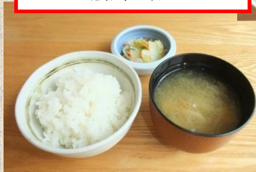
ご飯セット (ご飯+味噌汁+漬物)