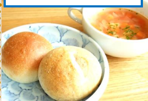
パンセット (パン+スープ)