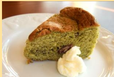
デザート (お選びいただけます)