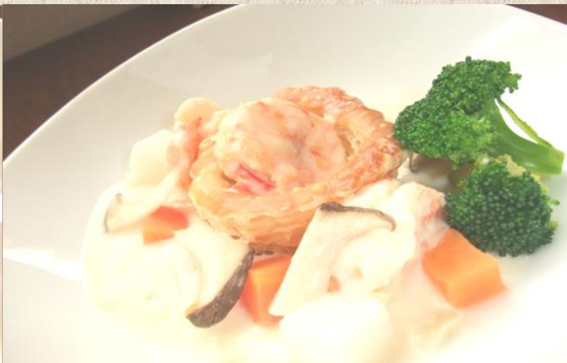
サクサクパイとエビのクリーム煮