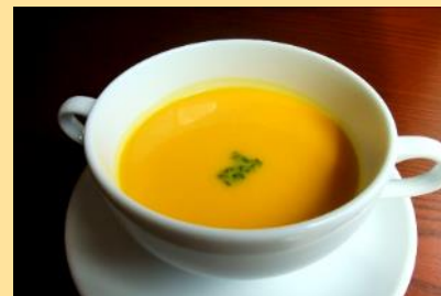
スープ (お選びいただけます ※)

◆当店では、食品衛生法上の特定原材料7品目の使用について以下のように表示をしております。