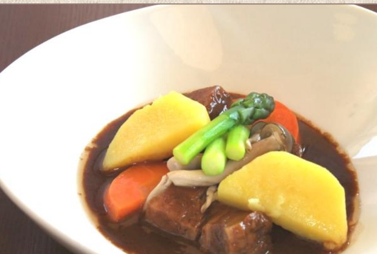
はちちょう 牛肉ハチデミグラソース