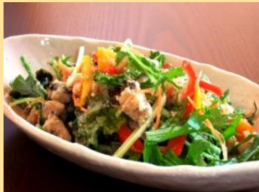
くるみ 野菜とおからのサラダ