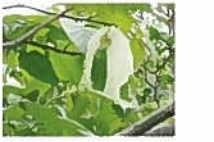
シンボルツリー「ハンガチの木」

日常生活で常時介護を必要とし、自宅での生活が困難な方へ生活全般（食事、入浴、排泄など）の介護サービスを提供しています。