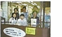
支援センターの専門相談員

「身近な地域の総合相談窓口」として、在宅介護に関する様々な相談に対応し、各種の生活支援サービス、介護保険サービス、住宅改修などの情報提供、総合調整を行います。福祉・医療・権利擁護などのサービスを包括的に提供していくために、武蔵野市の地域包括支援センターと連携しています。