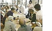
デイサービスでの料理活動

身体の機能を維持したり、はりのある生活や趣味活動をしたり、また、介護者の負担を軽減するために、通所型の介護サービスを提供しています。