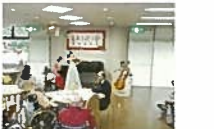
特養ホームでの敬老会

介護者が手を休めたり、諸事情により一時的に家庭で介護が受けられない方へ、短期間、施設での介護サービスを提供しています。