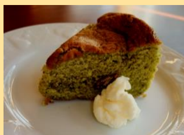
ケーキ(お選びいただけます)