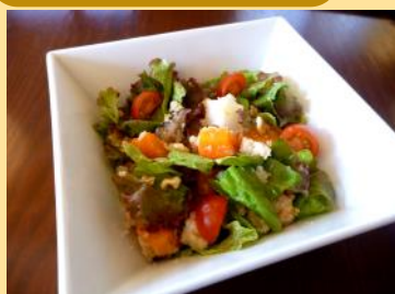
野菜とおからのサラダ ※季節や入荷状況により、 野菜の種類は異なります