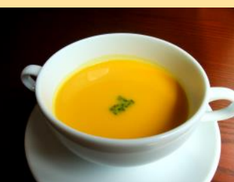
かぼちゃのポタージュ (温/冷)