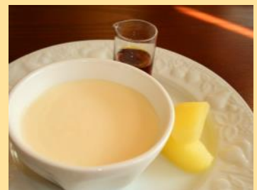
クリーミープリン