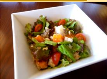
野菜とおからのサラダ