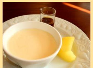
クリーミープリン