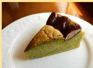
ケーキ(お選びいただけます)