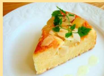
ケーキ (お選びいただけます)