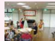
特養ホームでの敬老会

介護者が手を休めたり、諸事情により一時的に家庭で介護が受けられない方へ、短期間、施設での介護サービスを提供しています。