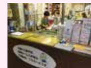
支援センターの専門相談員

「身近な地域の総合相談窓口」として、在宅介護に関する様々な相談に対応し、各種の生活支援サービス、介護保険サービス、住宅改修などの情報提供、総合調整を行います。福祉・医療・権利擁護などのサービスを包括的に提供していくために、武蔵野市の地域包括支援センターと連携しています。