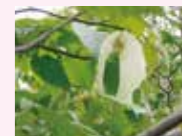
シンボルツリー「ハンカチの木」

日常生活で常時介護を必要とし、自宅での生活が困難な方へ生活全般(食事、入浴、排せなど)の介護サービスを提供しています。