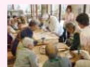
デイサービスでの料理活動

身体の機能を維持したり、はりのある生活や趣味活動をしたり、また、介護者の負担を軽減するために、通所型の介護サービスを提供しています。