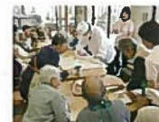
デイサービスでの料理活動

身体の機能を維持したり、はりのある生活や趣味活動をしたり、また、介護者の負担を軽減するために、通所型の介護サービスを提供しています。