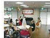
特養ホームでの敬老会

介護者が手を休めたり、諸事情により一時的に家庭で介護が受けられない方へ、短期間、施設での介護サービスを提供しています。