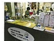
支援センターの専門相談員

「身近な地域の総合相談窓口」として、在宅介護に関する様々な相談に対応し、各種の生活支援サービス、介護保険サービス、住宅改修などの情報提供、総合調整を行います。福祉・医療・権利擁護などのサービスを包括的に提供していくために、武蔵野市の地域包括支援センターと連携しています。