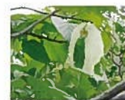
シンボルツリー「ハンカチの木」

日常生活で常時介護を必要とし、自宅での生活が困難な方へ生活全般(食事、入浴、排泄など)の介護サービスを提供しています。