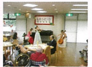
特養ホームでの敬老会

介護者が手を休めたり、諸事情により一時的に家庭で介護が受けられない方へ、短期間、施設での介護サービスを提供しています。