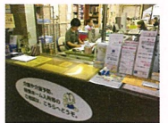
支援センターの専門相談員

「身近な地域の総合相談窓口」として、在宅介護に関する様々な相談に対応し、各種の生活支援サービス、介護保険サービス、住宅改修などの情報提供、総合調整を行います。福祉・医療・権利擁護などのサービスを包括的に提供していくために、武蔵野市の地域包括支援センターと連携しています。