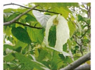
シンボルツリー「ハンカチの木」

日常生活で常時介護を必要とし、自宅での生活が困難な方へ生活全般(食事、入浴、排泄など)の介護サービスを提供しています。