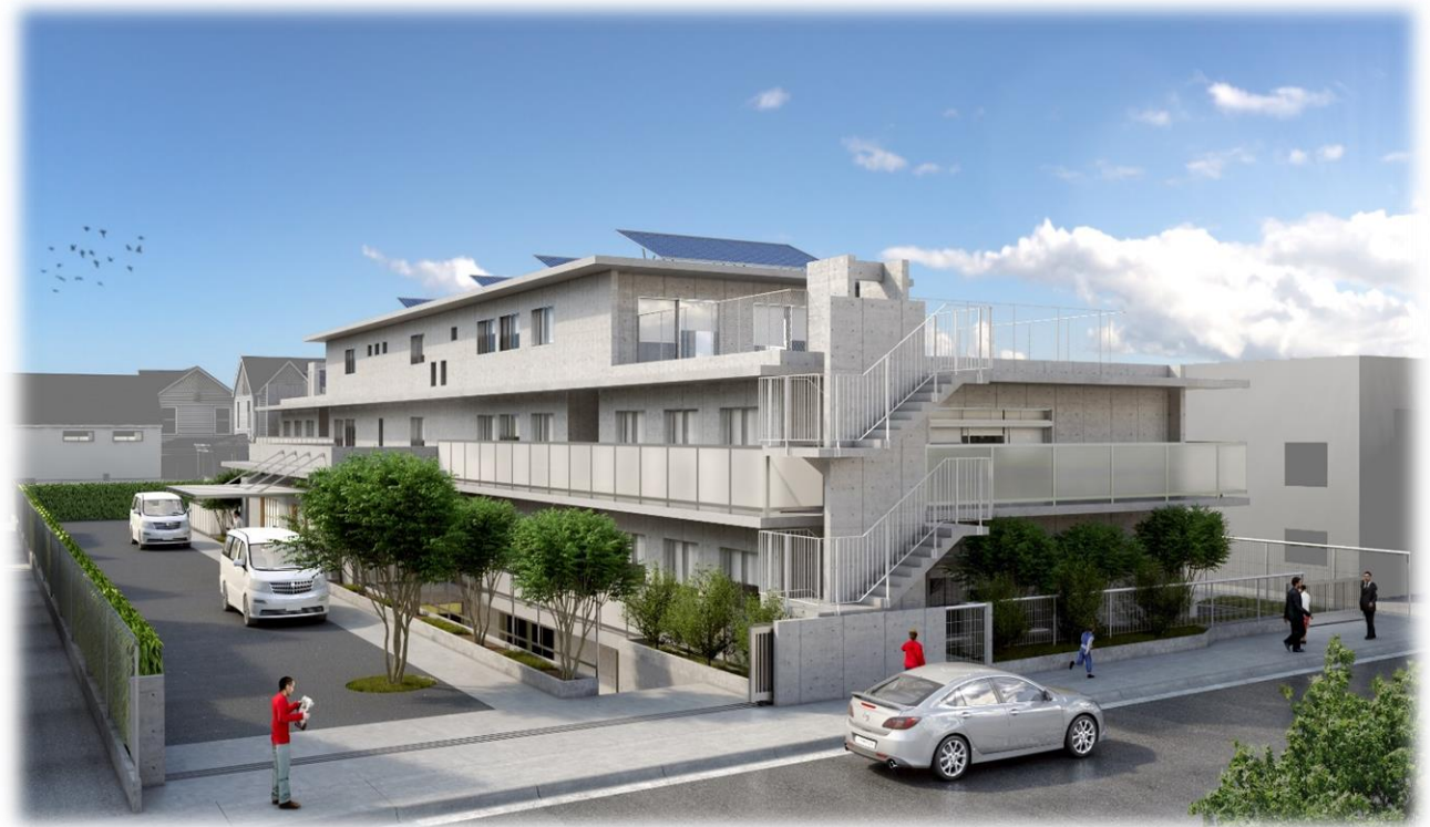
(仮称) 吉祥寺北町施設 完成図 平成31年3月開設予定