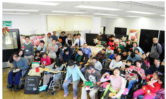
デイセンターふれあい