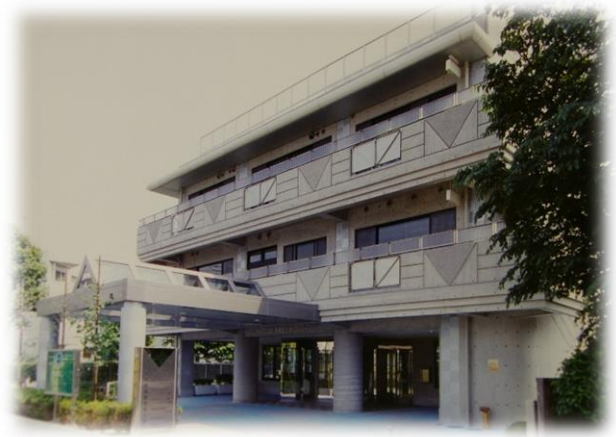
武蔵野障害者総合センター