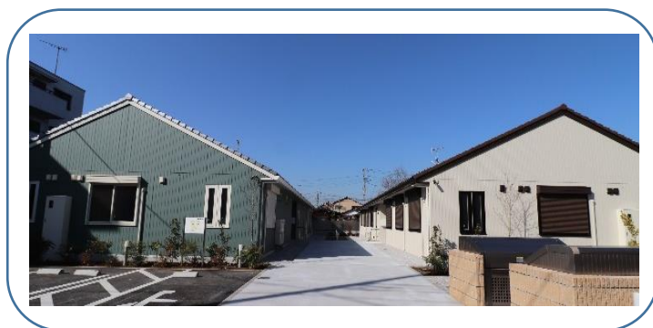
障害者グループホームかしの木 北館・南館 令和3年3月開設

※応募書類は返却いたしません。当法人「個人情報の取り扱い規則」に則り廃棄いたします