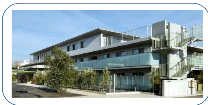
障害者地域生活支援ステーションわくらす武蔵野 ～6つの機能をもつ複合施設～

※応募書類は返却いたしません。当法人「個人情報の取り扱い規則」に則り廃棄いたします