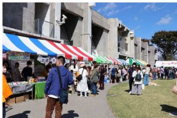
第21回むさしのあったかまつり (市民の方とのふれあい)(武蔵野エコレポートにて)