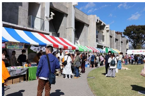
第 21 回むさしのあったかまつり (市民の方とのふれあい) (武蔵野エコ re ゾートにて)

※奨学金返還支援制度開始！！ 毎月 1 万円代理返還 (令和 6 年 10 月より)