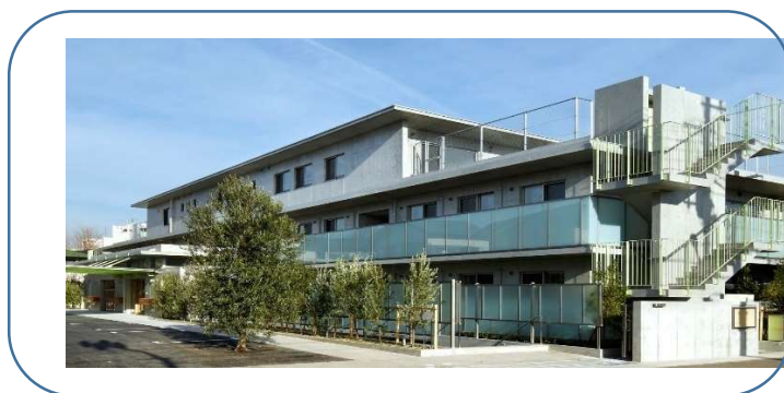
障害者地域生活支援ステーションわくらす武蔵野 ～6つの機能をもつ複合施設～

※応募書類は返却いたしません。当法人「個人情報の取り扱い規則」に則り廃棄いたします