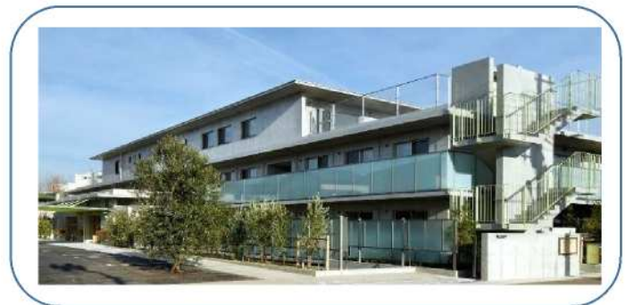
障害者地域生活支援ステーションわくらす武蔵野 ～6つの機能をもつ複合施設～

※応募書類は返却いたしません。当法人「個人情報の取り扱い規則」に則り廃棄いたします