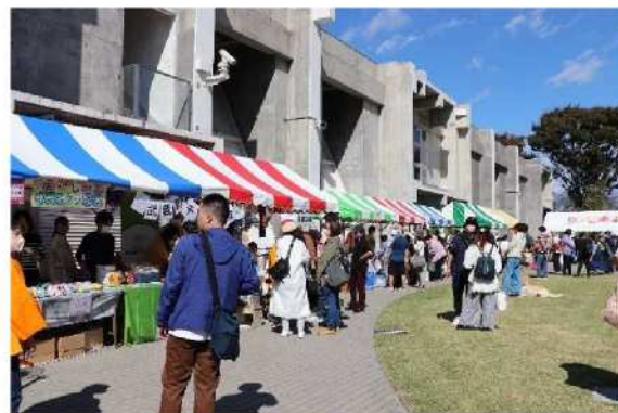
第21回むさしのあつたかまつり (市民の方とのふれあい)(武蔵野エコreゾートにて)