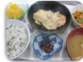
お肉系のサンプル