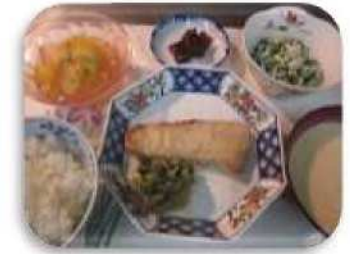
お魚系のサンプル